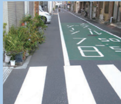
新設された横断歩道（蔵前小学校付近）

後を絶たない交通事故の発生を防ぐために、事故多発地帯の道路環境の点検を行うよう求めてまいりました。さらに全国で相次いだ集団登校中の痛ましい交通事故の発生を受けて、5月17日に学校通学路の安全対策をもとめ緊急要望を行いました。その要望を受けて、区教育委員会は関係機関と連携を取り、7月～8月にかけて緊急合同点検を実施し危険箇所については、蔵前小学校通学路において、横断歩道を新設するなど安全対策を進めています。