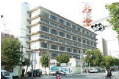
跡地利用が検討される旧東京北部小包集中局

その他、教育行政に取り組む新教育長の決意、平成23年度決算に対する区長の総括、喫煙スペースの整備、生活保護担当職員の配置問題について質問しました。