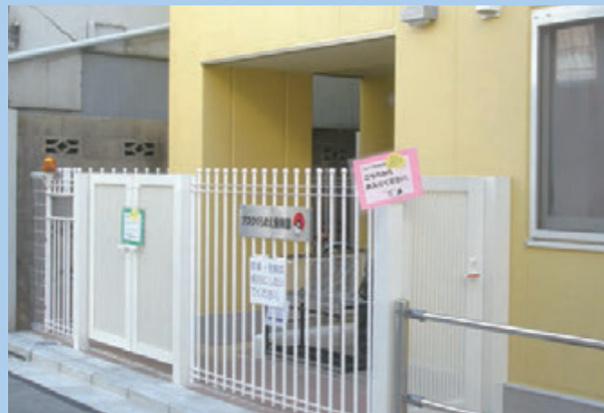
アスクくらまえ保育園

待機児童解消のために、保育所の地域偏在の解消を目指し、保育所の誘致を図るようもともとめてまいりました。その意向を受けた区は、積極的に保育所誘致を働きかけ、認可保育園「アスクくらまえ保育園」が11月1日から開所することになりました。