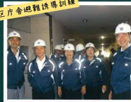
区庁舎避難誘導訓練

区庁舎内で行われた避難誘導訓練に参加しました。災害発生時には対策本部となる区庁舎は、大事な砦です。議員・職員が中心となって、大切な区民の命を守ります。