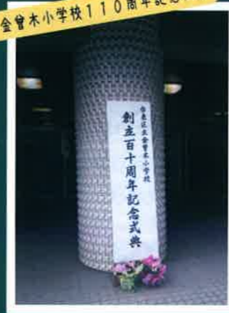
金曾木小学校110周年記念式典

10月19日に行われた金曾木小学校110周年記念式典に参加しました。今年、浅草小学校・根岸小学校（140周年）などが創立記念日を迎えます。