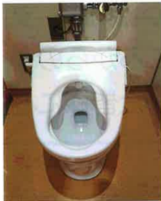
オストメイト対応の前広便座を推進