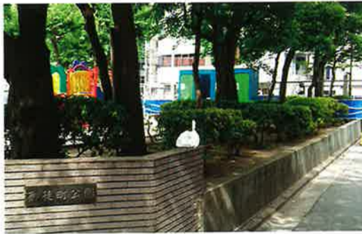
御徒町公園トイレ改装中